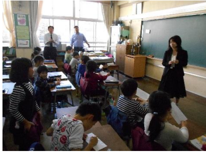
①親切にしたいけれど、できなかったこと

○身近な人に温かい心で接し、親切にすることは、より良い人間関係を築く上で大切なことである。様々な人との触れ合いの中で、相手の気持ちを考え、優しく親切にすることの大切さを知り、相手の喜びを自分の喜びとしてとらえられるようにする授業である。