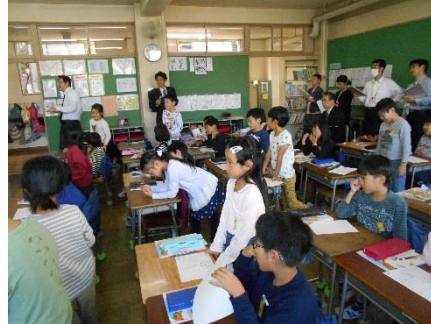
⑦自分への振り返り(人に親切にして良かったと思ったこと。)