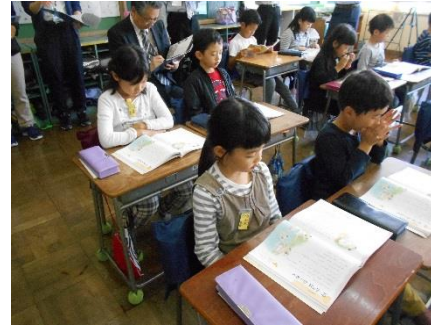
③すつくとさんざの気持ちを考えよう