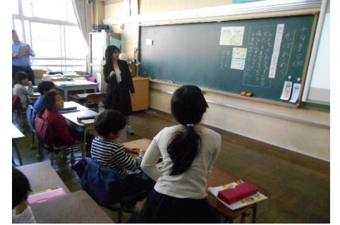
④「かんすけ、早くこいよ。置いていくよ。遅いなあ。」