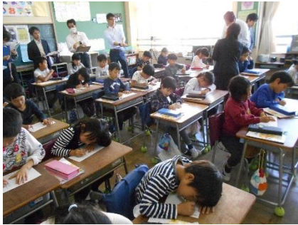
⑤その後、すつくとさんざに気持ちに変化はあったかな。