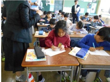
⑥「かんすけ、ごめんね。かんすけのおかげで助かったよ。」