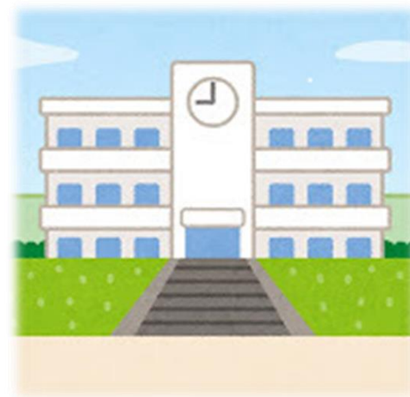
文京区立誠之小学校