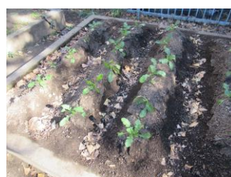
〈年長組が種をまいた大根〉