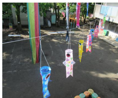
〈 年長組がグループの仲間と 作ったこいのぼり 〉