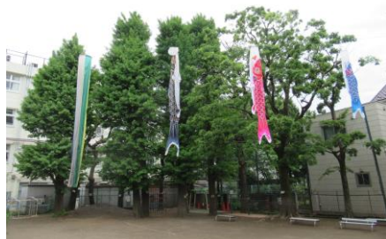
〈 園庭のイチヨウ 〉

朝、立ち止まって、目と目を合わせてあいさつできると、心と心が通じたような気持ちがして、とても嬉しくなります。「今日は元気いっぱいだな」「何か心配なことがあるのかな」など、気が付くこともたくさんあります。朝のあいさつからその日の調子が分かります。ご家庭でも、幼稚園でも「おはようございます」「さようなら」「ありがとう」などのあいさつを大切に過ごしていきたいですね。