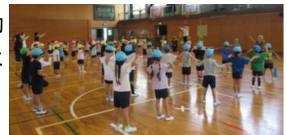
みんなで体操（体育館）

千駄木幼稚園の特色ある教育活動の一つに、 運動遊び があります。運動会の会場としてお借りする文林中学校の広い校庭や体育館は、子どもたちにとって、ぐるぐる走ったり、のびのび踊ったり、思わず体を動かしたくなる場所です。運動会をきっかけとして、子どもたちが運動遊びをより一層好きになるように、支えていきたいと思えます。