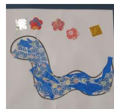
〈年中組 へビを貼り絵で表現〉