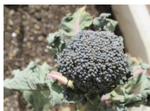
〈年少組の育てている ブロッコリー〉